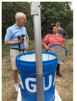
Tour por el Sur de la Frontera de Texas: agua en el camino para migrantes

Escuchen las historias de valientes pastores mexicanos, padres e hijos cansados que buscan asilo, y funcionarios públicos con un corazón para el apuro de los inmigrantes . Escuchen las perspectivas de los participantes de “MCC South Texas Borderlands Tour.” (El