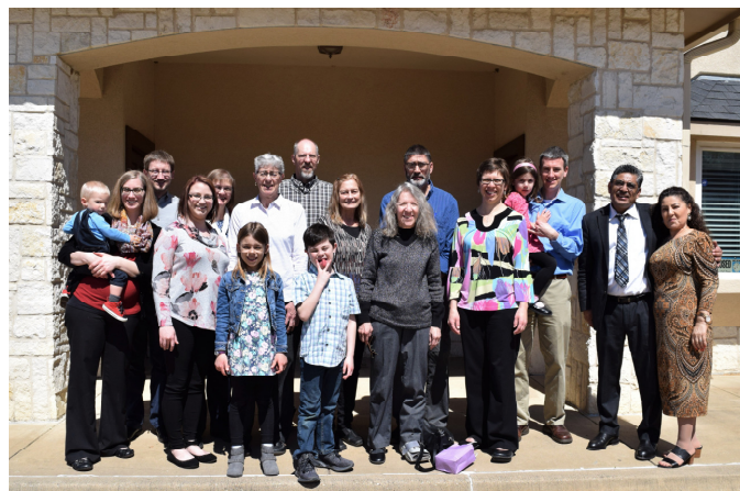
Miembros de la Iglesia Menonita Alexanderwohl, Goessel, KS, y Luz del Evangelio, Dallas, TX en una visita reciente a Dallas.

La iglesia de Aposento Alto se reúne en las instalaciones de la Mennonite Church of the Servant (Wichita, KS). Casa Betania (Newton, KS) se conecta con un grupo de apoyo de la iglesia Menonite Bethel College, Shalom y First Mennonite (Newton). Monte Horeb, Comunidad de Esperanza, Luz del Evangelio y Southern Hills Mennonite Church se asociaron para apoyar el plantamiento de la iglesia Camino Nuevo en Dallas, TX. El Grupo de Jóvenes FEWZ (jóvenes combinados de las iglesias First, Eden y West Zion en Moundridge, KS) está ofreciendo ayuda financiera para que jóvenes de la WDC de Texas viajen a MennoCon19 en Kansas City. First (Halstead) y la Iglesia Menonita Bethel College recientemente celebraron juntos un retiro de la iglesia en Camp Mennoscah; otras congregaciones celebran las vacaciones de la escuela bíblica juntas en verano.