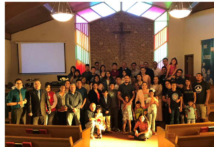
Iglesia Camino de Santidad después del culto, mayo de 2019.

El segundo en una serie con congregaciones en la WDC